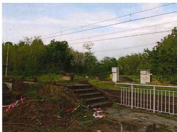
UČS 01, Demontáž lávky