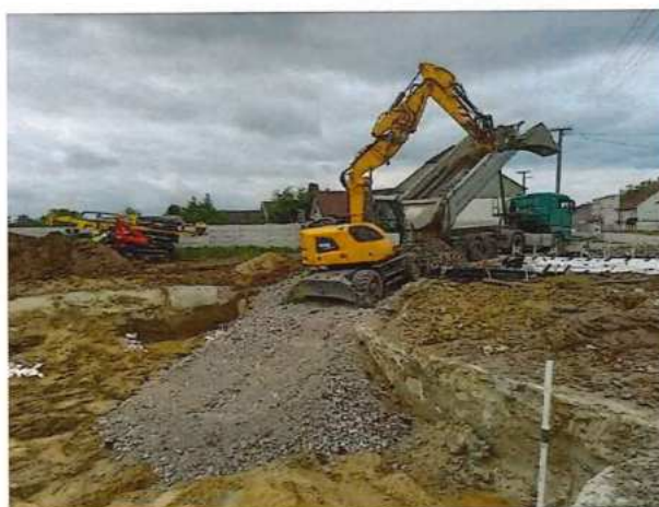
UČS 11, Budovanie prístupovej komunikácie a rampy podjazd