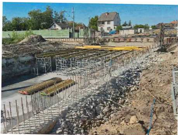
UČS 11, Podjazd Brodské extravilán