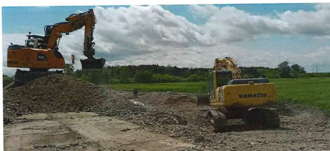
UČS 10, prístupová cesta TNS Kúty