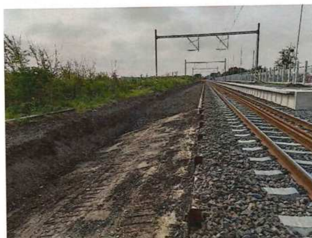
UČS 11, Odkop zeminy a výmena škvarového podložia