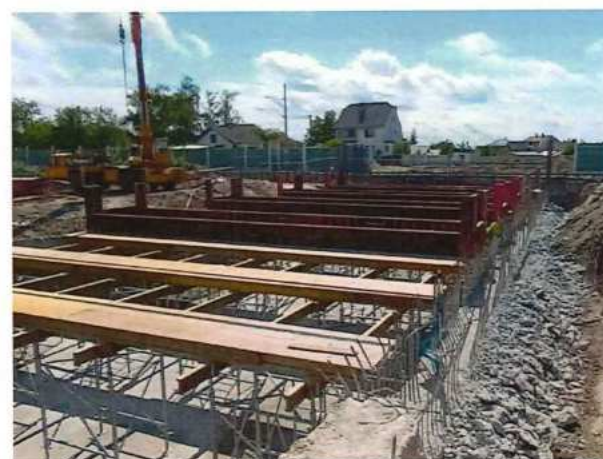
UČS 11, Rozperné trámy podjazd Brodské