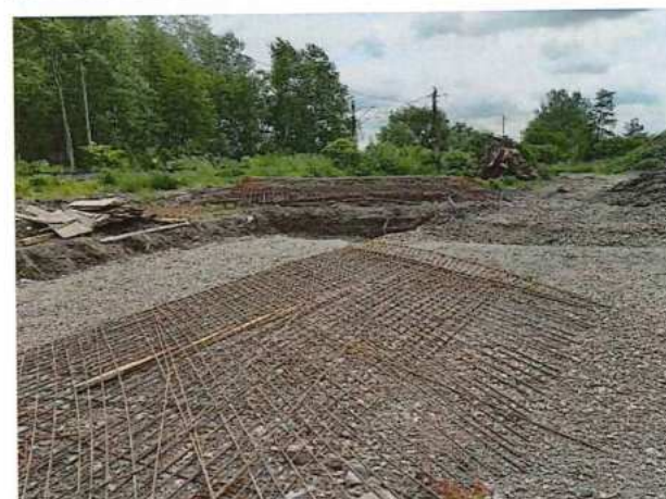
UČS 10, prípravné práce TNS Kúty