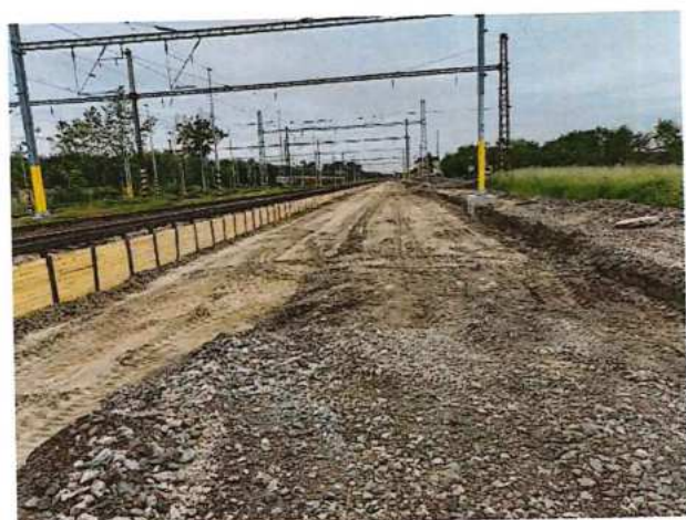
UČS 02, Odkop zeminy po zemnú pláň