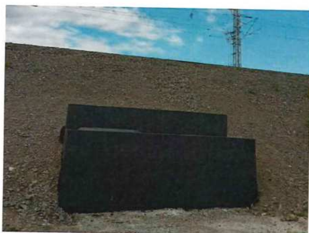
UČS 12, Ukončenie šacht KCHT