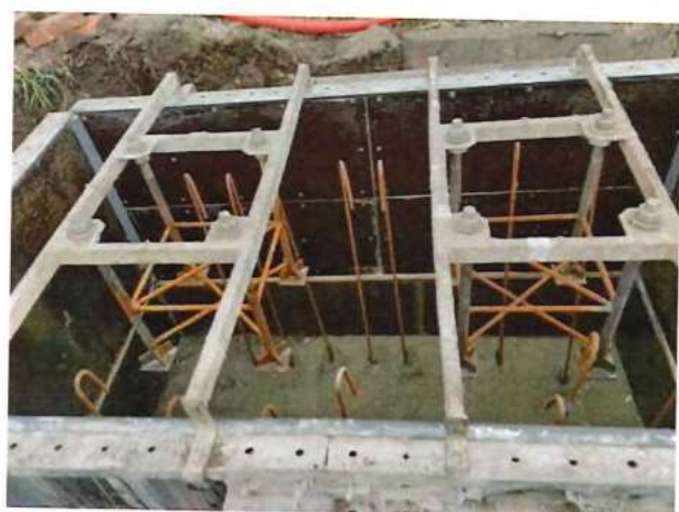
UČS 02, Betonáž základov trakčných podpier