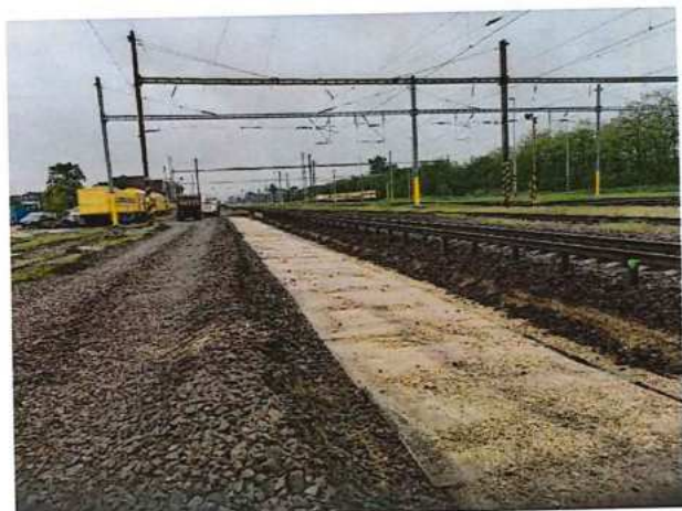
UČS 02, Odraženie koľajového kameňa