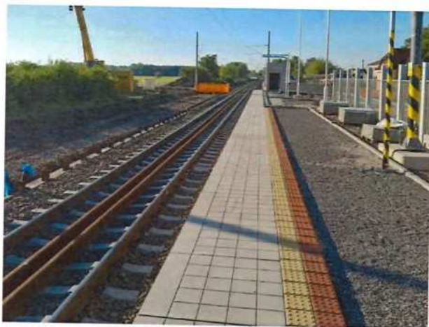
UČS 11, Pokládka dlažby nástupisko Brodské