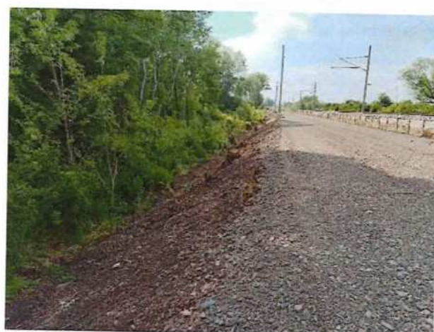
UČS 12, Úprava svahov od náletových drevín