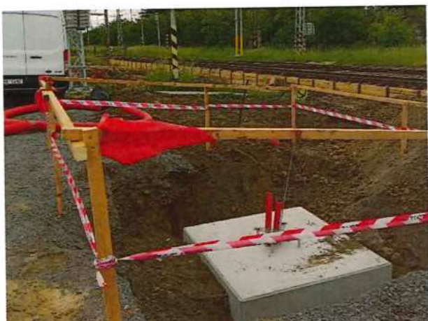
UČS 02, Realizácia základov pre piliere