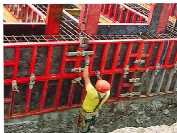
UČS 11, Armovanie, debnenie stien podjazd