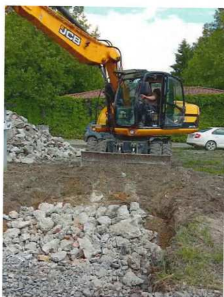
UČS 01, Búranie základov