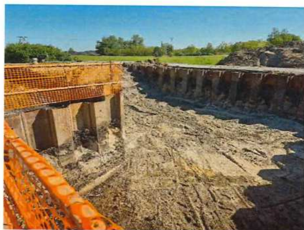
UČS 11, Výkopy podchod Brodské