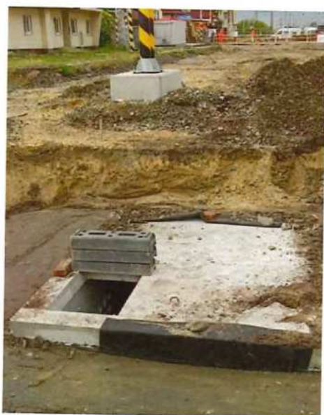
UČS 02, Realizácia kábelových šácht