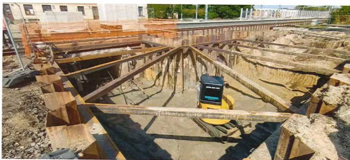
UČS 11, Výkopy podchod Brodské