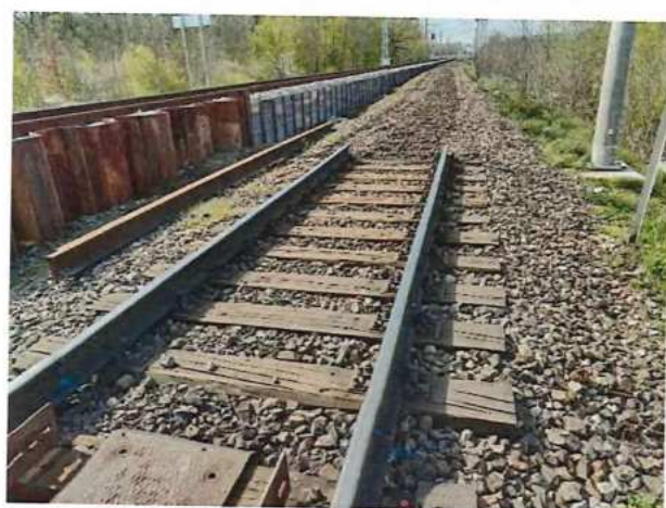
UČS 11, 10, Odřazení kořajového kameniva