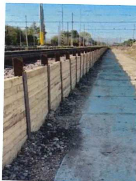
UČS 02, Baranenie HEB, záporové paženie a odťazenie kameniva pod koľajou č. 1