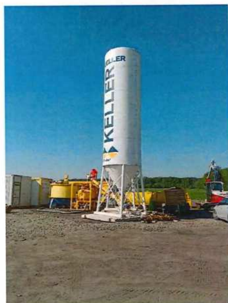
UČS 12, Mobilizácia špeciálne zakladanie