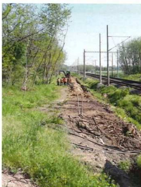
UČS 01, Prekládka kabeláže