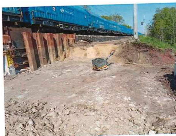
UČS 12, Plošiny pre injektáž