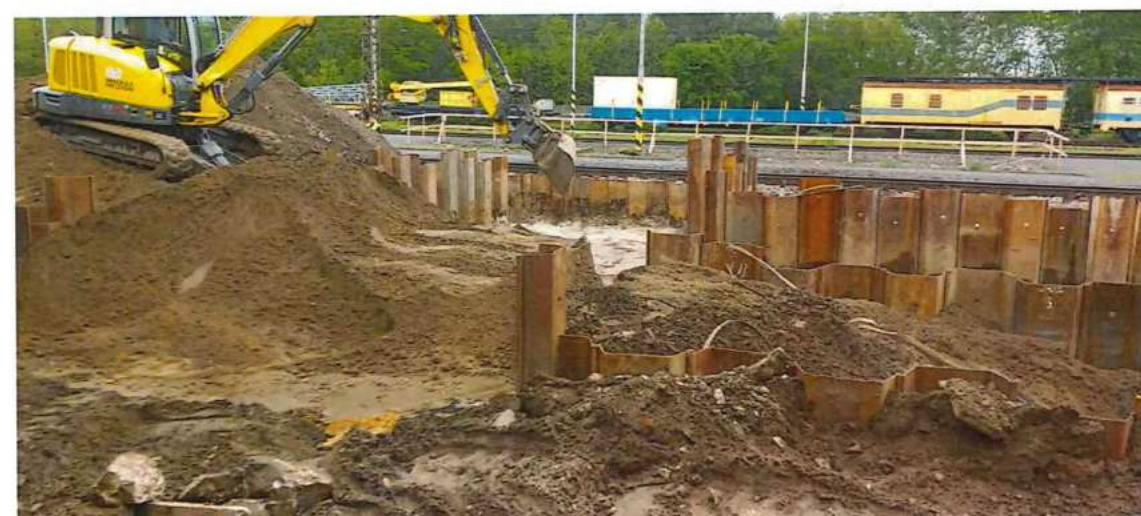
UČS 02, Výkopy podchod Zohor