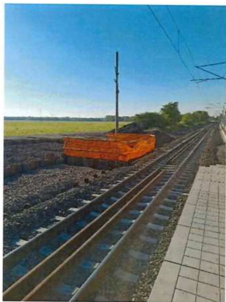
UČS 11, Baranenie štetovnic podchod Brodské