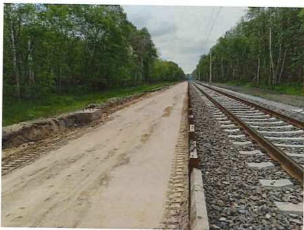
UČS 10, Odkop zeminy po zemnú pláň a vykonanie SZS