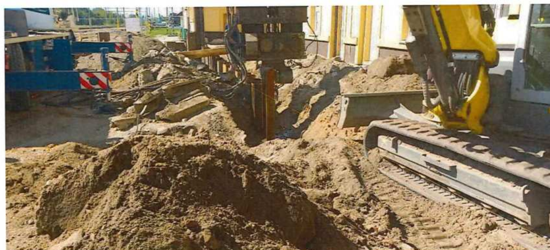
UČS 02, Baranenie štetovnic podchod v žst Zohor