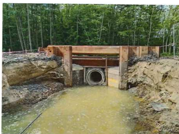
UČS 10, Prípravné práce na priepuste č.7