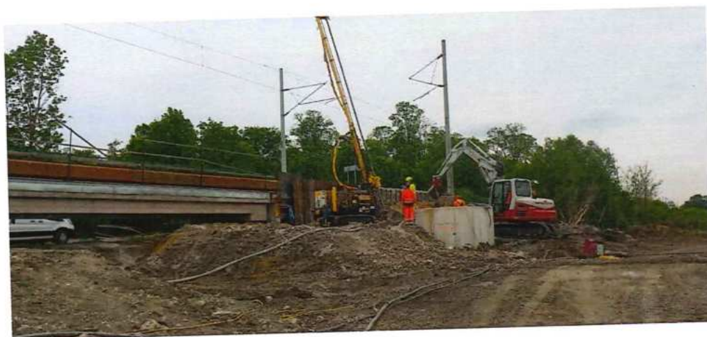
UČS 12, Trysková injektáž, mosty