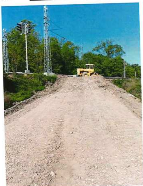
UČS 12, Prístupová komunikácia ku koľaji č.2