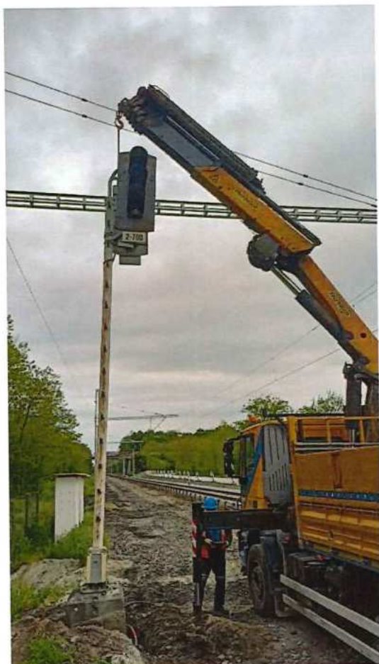
UČS 10, Demontáž návěstidiel