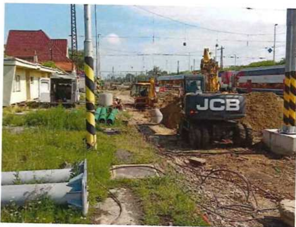
UČS 02, Budovanie kanalizácie