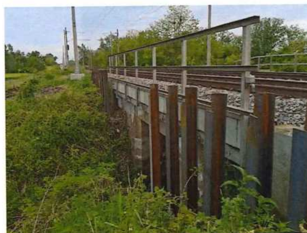
UČS 0,1 Baranenie kontrastných HEB profilov pri priepustoch a mostoch