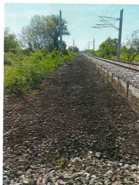
UČS 12, Odťazenie koľajového kameniva