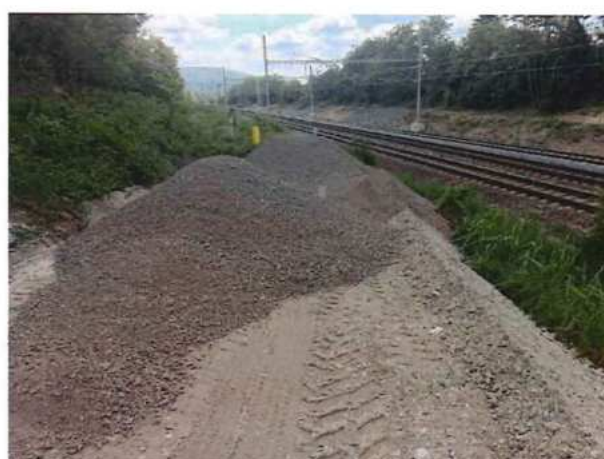
UČS 01, Prístupové komunikácie