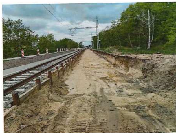
UČS 11, 10, Odčazenie koľajového kameniva a zemín po zemnú pláň