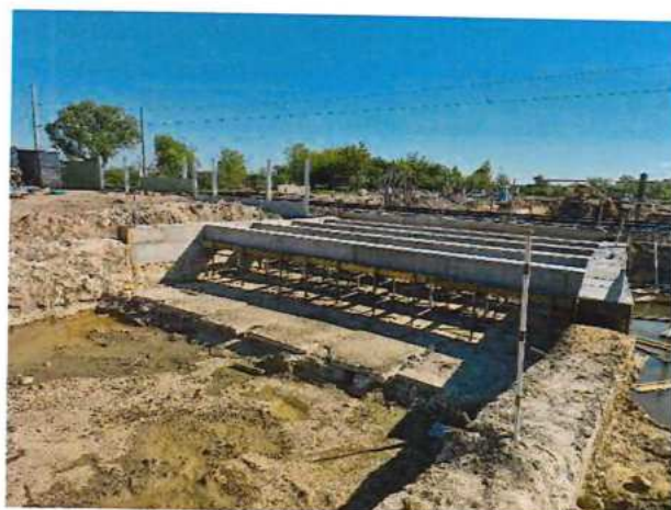
UČS 11, Podjazd Brodské intravilán