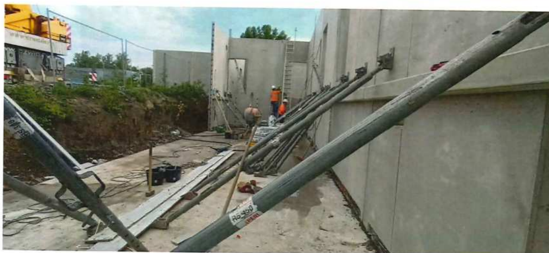
UČS 10, Montáž stien TNS Kúty