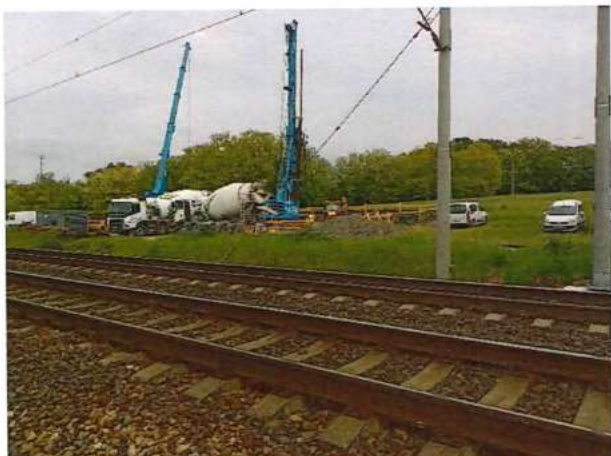
UČS 01, Testovacie pilóty