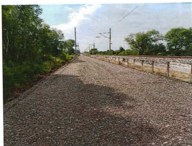
UČS 12, Statické zaťažovacie skúšky zemnej pláne