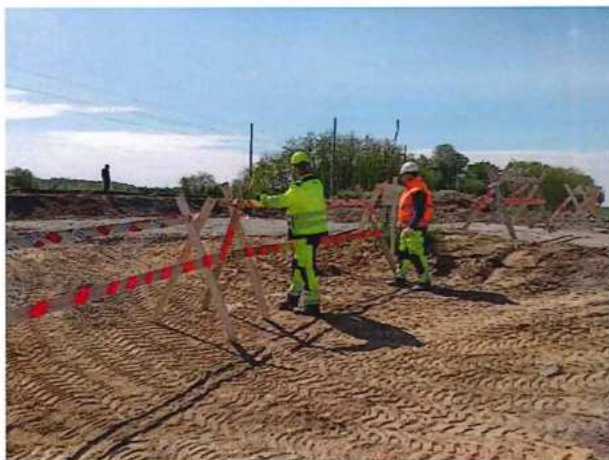
UČS 01, Osadenie zátarás na ceste III/1106