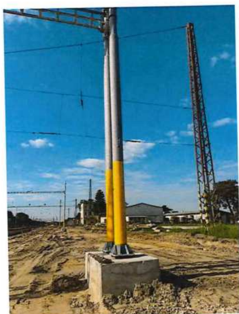
UČS 02, Zemné práce železničný