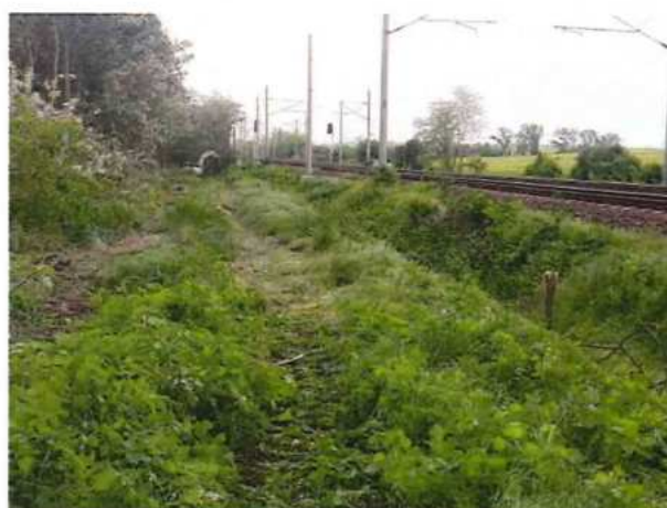
UČS 01, Výruby