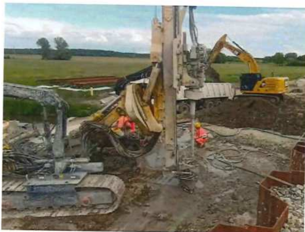
UČS 12, Zakladanie mosty - mikropilóty