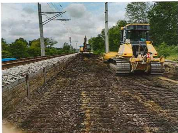
UČS 12, Odkop zeminy po zemnú pláň