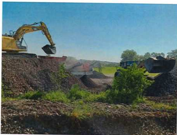
UČS 10, 11, Triedenie koľajového kameniva