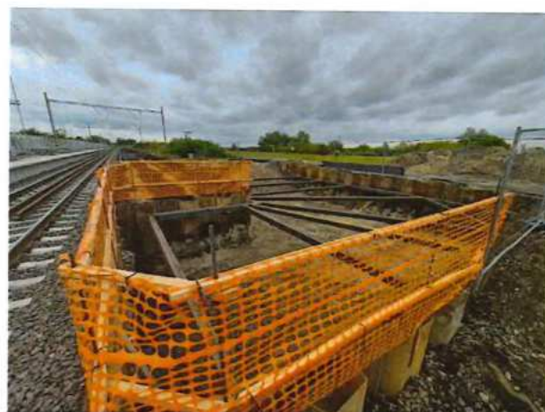
UČS 11, Rozperný rám podchod Brodské