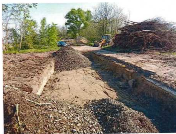
UČS 02, Mobilizácia a príprava pracovných plošín pre skúšobné pilóty