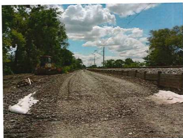
UČS 12, Zriadenie pláne železničného spodku