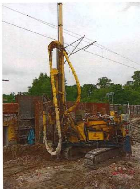
UČS 12, Realizácia mikropilóty