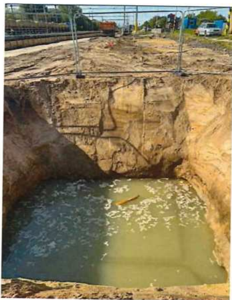
UČS 02, Šachty kábelovej trasy