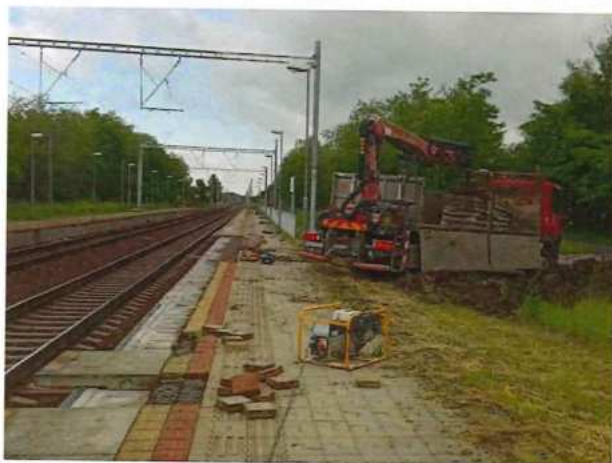
UČS 01, Rozoberanie nástupiska zástavka Devínske Jazero