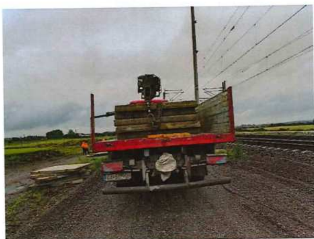
UČS 01, Prístupové komunikácie