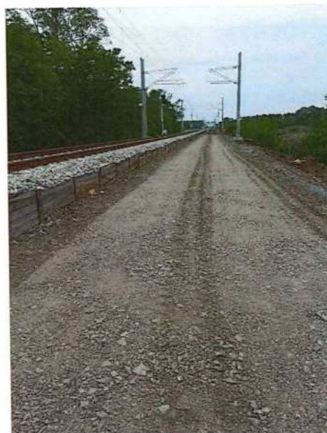
UČS 12, Rozprestretie geotextílie a zriadenie pláne železničného spodku