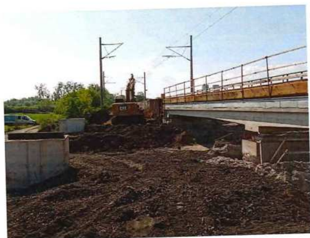
UČS 12, Demolácia malých mostov