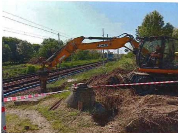
UČS 01, Búranie základov lávka