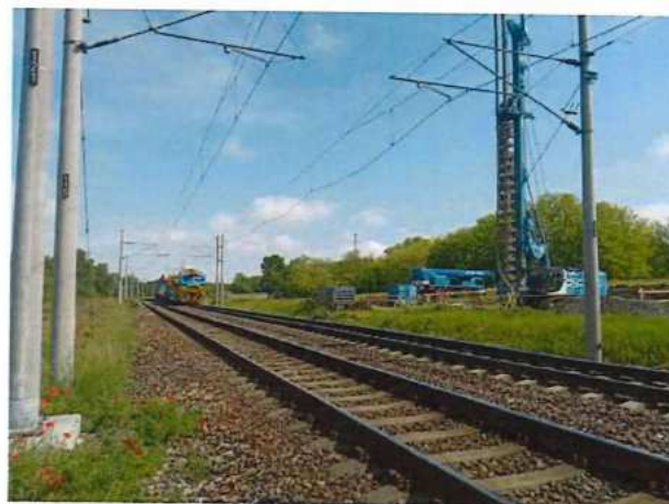
UČS 01, Demontáž trakčného vedenia