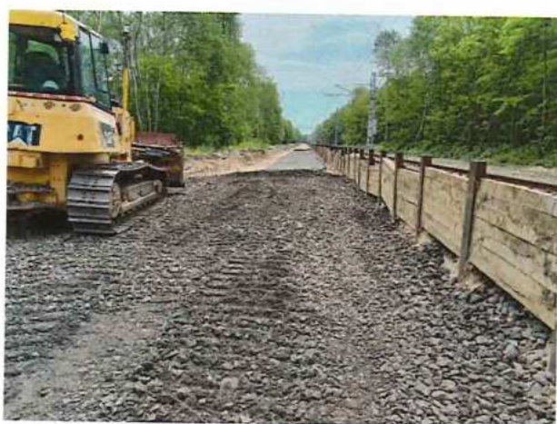
UČS 10, Zriadenie pláne PŽS