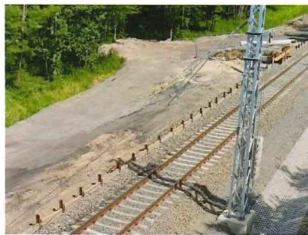
UČS 10, Zrútenie rímky mosta do koľajového priestoru